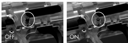
X-Ray Goggle Figure. 1

El dispositivo de bloqueo del cañón debe estar instalado en todo momento cuando el marcador no está siendo disparado, junto con